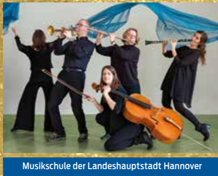
Musikschule der Landeshauptstadt Hannover